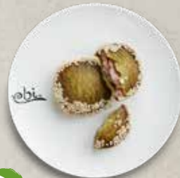
D3 TARO KUCHEN mit Sesam