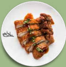
91 CRISPY DUCK mit würziger Sojasoße