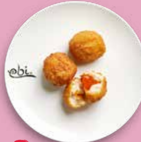
76 CHICKEN POPS Sweet Chili Filling