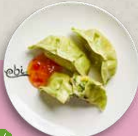
V 71 VEGGIE GYOZA mit Sweet Chili Soße