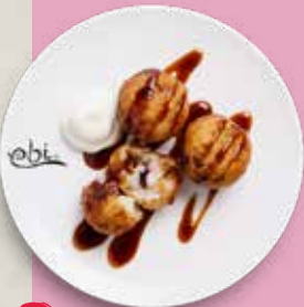
74 TAKOYAKI Jap. Teigbällchen, Oktopus Takoyaki Soße, Mayo