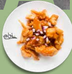
87 SÜSS SAUER HUHN Zwiebel, Süß Sauer Soße