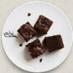
D5 SCHOKO BROWNIE