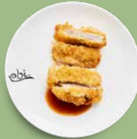
90 PORK TONKATSU mit jap. Tonkatsu Soße