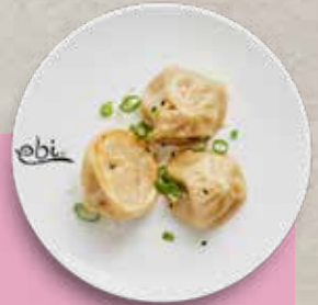
73 PORK BAO Hackfleisch, Gemüse