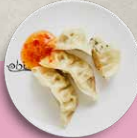
72 CHICKEN GYOZA mit Sweet Chili Soße