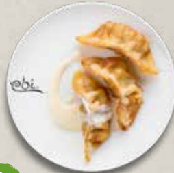
D2 APPLE GYOZA mit Vanillesoße