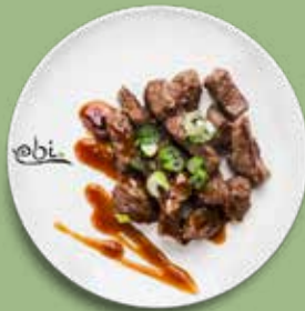
95 RINDERSTEAK mit Teriyakisoße