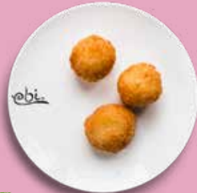
V 75 CHEESE KOROKKE Kartoffel, Käse