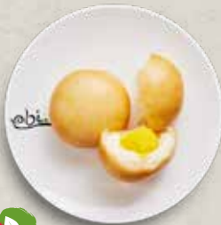
D1 CUSTARD BAO mit Vanillefüllung