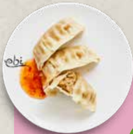
70 PORK GYOZA mit Sweet Chili Soße