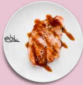
102 LACHSSTEAK mit Teriyakisoße