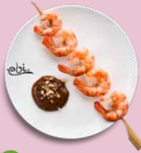
107 GARNELENSPIESS mit Erdnuss Soße