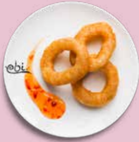
100 CALAMARI mit Sweet Chili Soße