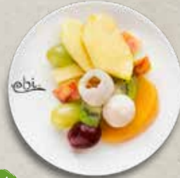
V D7 OBSTSCHALE saisonales Obst