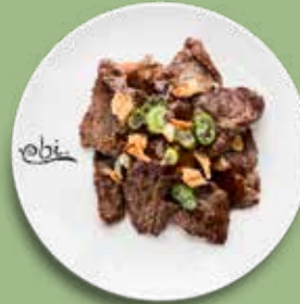
93 RINDFLEISCH mit würziger Sojasoße