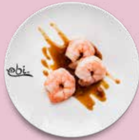
106 GARNELEN mit würziger Sojasoße