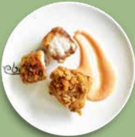
88 KARAAGE Hühnerkeule, Spicy Mayo