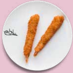
105 TORPEDO GARNELEN mit Spicy Mayo