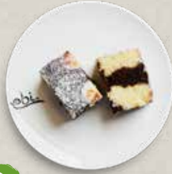
D6 SCHOKO KOKOS KUCHEN