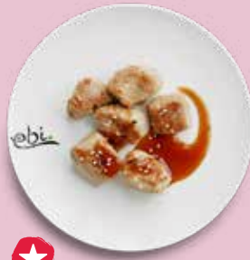
101 TUNA BITES mit Teriyakisoße