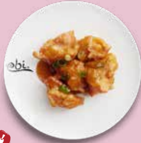
103 LACHS NUGGETS mit Gong Bao Soße