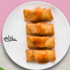
V 78 MINI ROLLS mit Süß Sauer Soße