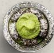
D8 MATCHA MOUSSE (+3,80€)