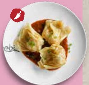
77 SPICY WANTAN Huhn, Gong Bao Soße