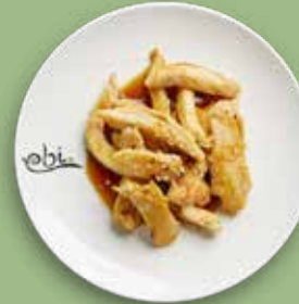
94 CHICKEN TERIYAKI mit Teriyakisoße