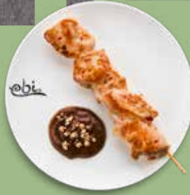
86 HÜHNERSPIESS mit Erdnuss Soße