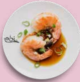
104 TIGERGARNELEN mit würziger Sojasoße (+4,80€)