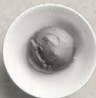
D11 BLACK SESAME