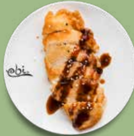
89 HÜHNERBRUST mit Teriyakisoße